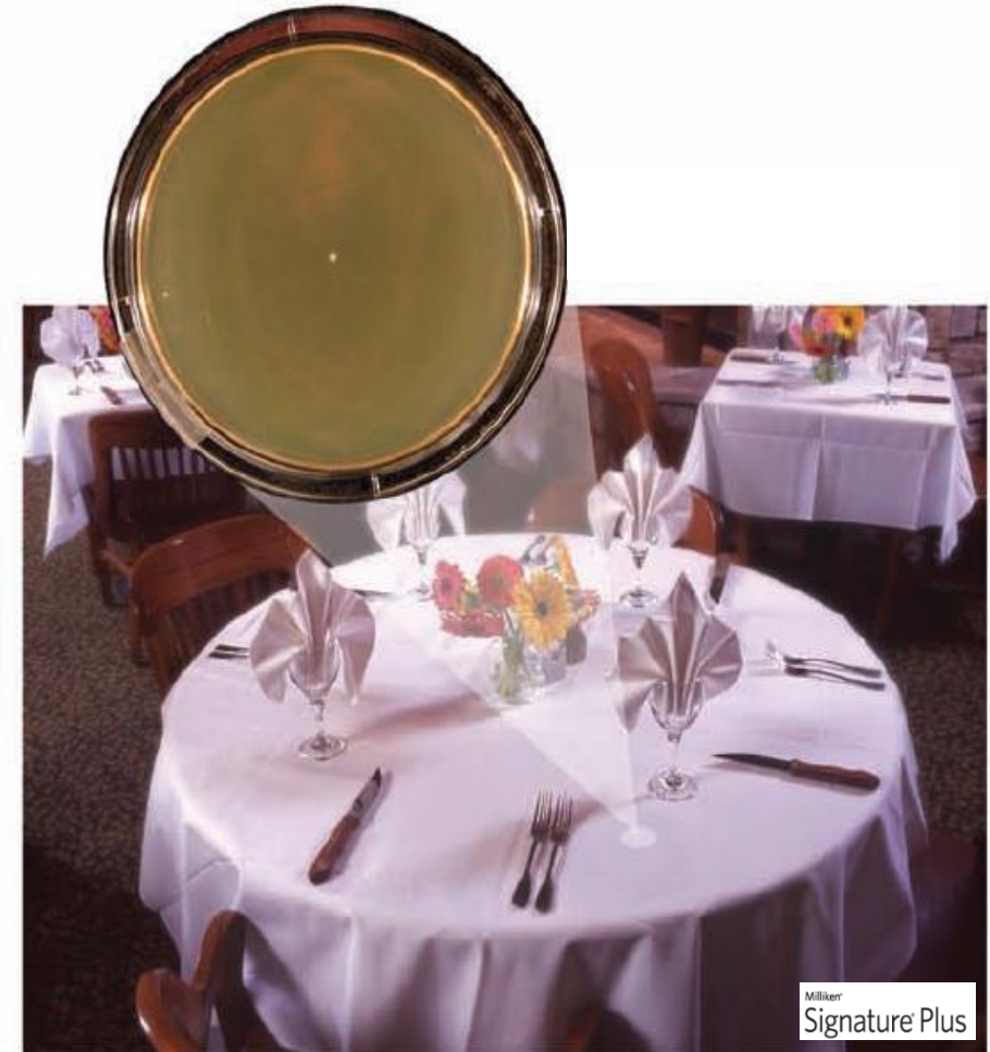
Faktiska bakterieprover med duk