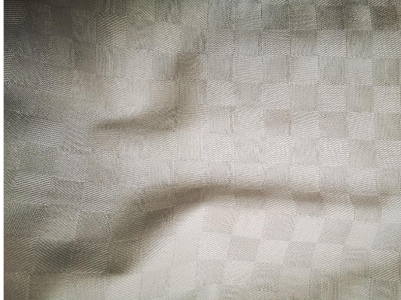
666 Paloma Grey