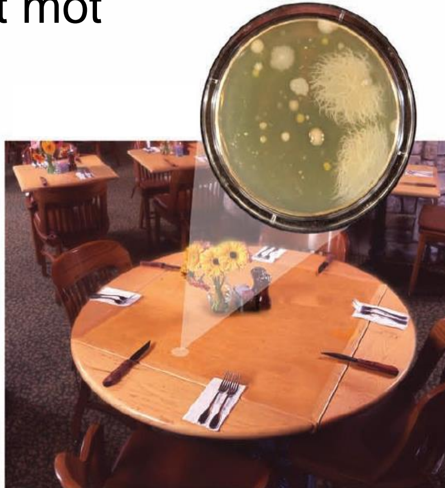
Faktiska bakterieprover utan duk