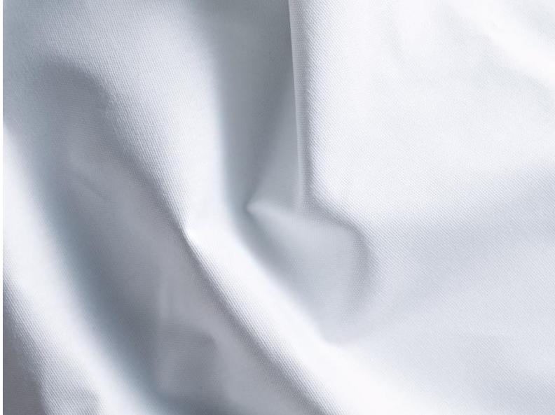
100 White * excl. recycled polyester